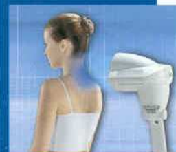
Použitie Farebnej terapie BIOPTRON Pro 1.