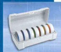
Farebná terapia BIOPTRON Pro 1 v praktickom balení.