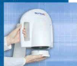
Výmena farebného filtra na prístroji BIOPTRON Pro 1.