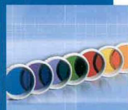
7 farebných filtrov Farebnej terapie BIOPTRON Pro 1.