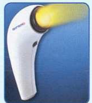
BIOPTRON Compact III